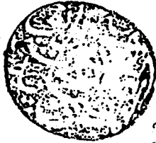
صورة الصفحة الأخيرة من نسخة التلخيص (ك)

يكثر من قول سبحان الله وبحمده استغفر الله واتوب اليه قالته فقلت يا رسول الله انزل تكثير من قول سبحان الله وبحمده استغفر الله واتوب اليه فقال خير لي من ان يسأري علامة في اميني فاذا راتها اكرت من قول سبحان الله استغفر الله واتوب اليه فقد راتني اذا جاني الله والفتح فتح مكة ورايت الناس راخطون في دين الله افواجها الي اخرها هذا اخر الخبر من صحاح محمد بن عبد الله بن عمنه تم العا كما تدل الله على النبي محمد واله وسلم كتبه العبد الفقير الراحه ربه ومغفوره ومغفرتة عليهم الازمان بحضور الانصار في عمدة الله عمده ولطف به امين وامن الفواعل من كتابته الرابع من شهر ربيع الثاني سنة ١٢٤٤ هـ