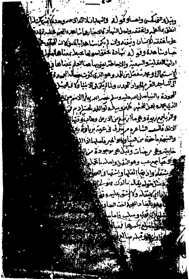
صورة الصفحة الأولى من نسخة المفهم (ش)