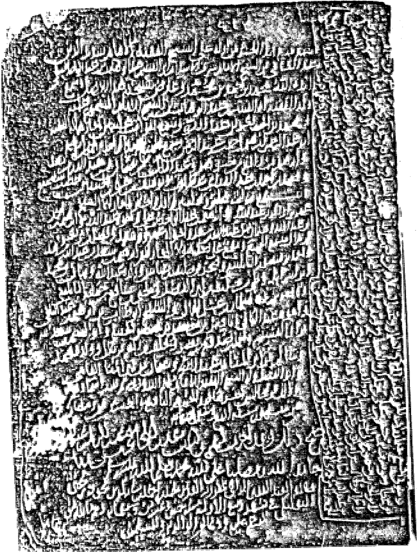
صورة من السماعات على آخر الجزء الرابع عشر من «الإبانة» الثالث من الرد على الجهمية «الأصل»