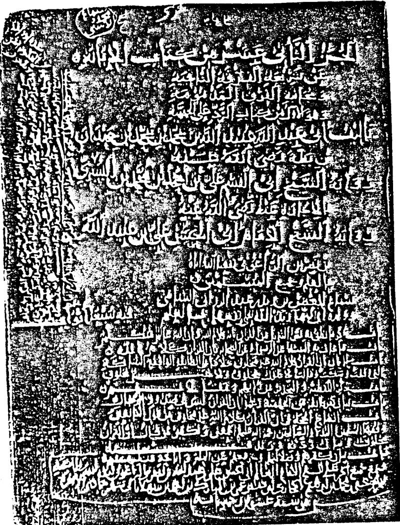
صورة الورقة الأولى «النسخة الأصل»

من الجزء الثاني عشر من «الإبانة»، وهو الأول من الرد على الجهمية