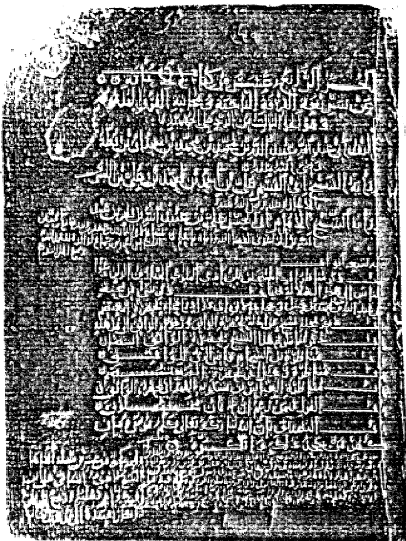
الجزء الرابع عشر من «الإبانة» «النسخة الأصل»